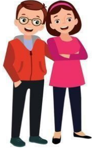
nanay at tatay

Panuto: Lagyan ng tsek (/) ang mga larawan ng mga taong puwede mong malapitan sa oras ng pang-aabuso, pang-anib, at karahasan.