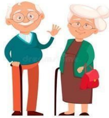
lolo at lola